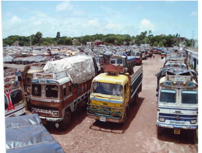
বেনাপোল স্থলবন্দরের ট্রাক টার্মিনাল