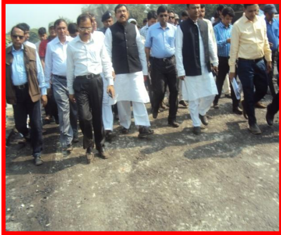
বেনাপোল স্থলবন্দরের বর্ডারের নবনির্মিত রাস্তার উন্ময়নের কাজ পরিদর্শন