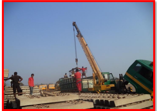
বেনাপোল স্থলবন্দরের অপারেশনাল কার্যক্রম