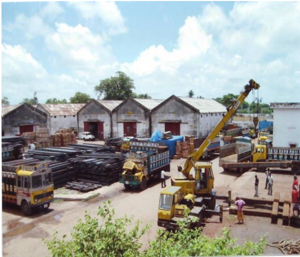
বেনাপোল স্থলবন্দরের অপারেশনাল কার্যক্রম