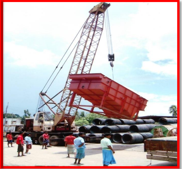
বেনাপোল স্থলবন্দরের অপারেশনাল কার্যক্রম